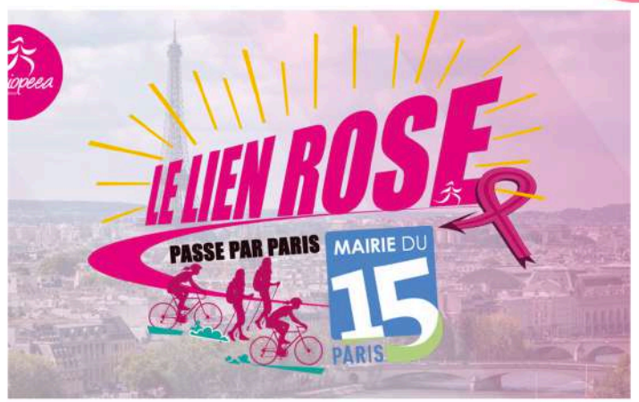
Table ronde « sport santé » à l'occasion d'Octobre Rose Mairie du 15e arrondissement, 15 octobre 2022, Paris. Le samedi 15 octobre 2022 de 10h12 à 12h00 gratuit Nous aimerions vous convier à cet événement : gratuit, sur inscription. Pour des informations complémentaires : nous contacter au +33 6 03 08 09 03 ou à casiopeea.france@gmail.com Casiopeea organise une table ronde sur le thème

https://www.unidivers.fr/event/table-ronde-sport-sante-mairie-du-15e-arrondissement/