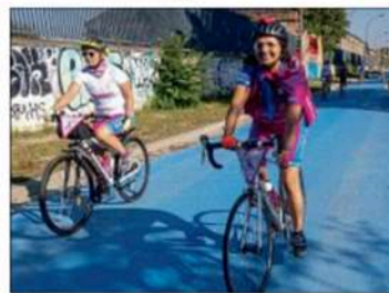
Un défi de 3.000 km à vélo via le secteur pour 50 femmes en traitement et rémission, à l'initiative de Casiopeea. (1)(2)

Surmonter la maladie par le sport, c'est le défi de femmes en traitement du cancer du sein et guéries, ou quotidiennement et pour "Le Lien rose" à vélo qui traverse la région mercredi 5 et jeudi 6 octobre. Prêts à prendre leurs routes ?