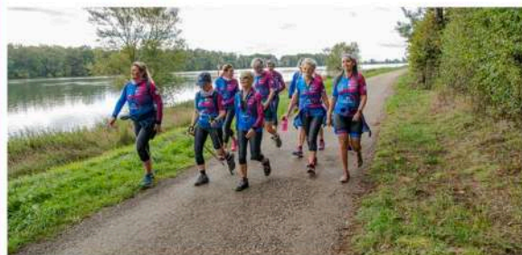
Les participantes du challenge sportif « Le Lien Rose » ont quitté Lyon le 1er octobre.

Parties de Lyon le 1er octobre à vélo ou à pied, les participantes du challenge sportif « Le Lien Rose » organisé par l'association Casiopeea dans le cadre d'Octobre Rose franchiront la ligne d'arrivée à Nantes samedi 22 octobre.