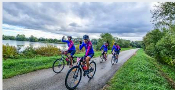
Publié le 14/10/2022 à 09h00