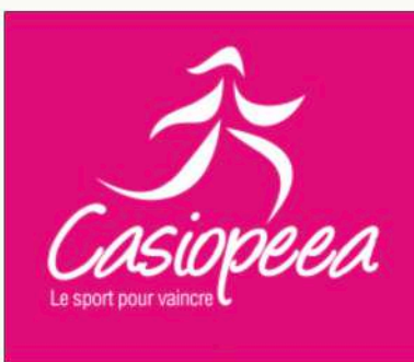
Table ronde "sport santé" avec Casiopeea

Chaque année au mois d'octobre, Casiopeea organise un challenge sportif majeur pour sensibiliser à la lutte contre le cancer du sein et promouvoir le sport-santé. Le 15 octobre prochain, une table ronde sur le thème « l'activité physique et le cancer : un couple pour faire de la prévention et prévenir les risques de récurrence », aura lieu à la Mairie du 15ème arrondissement de Paris.